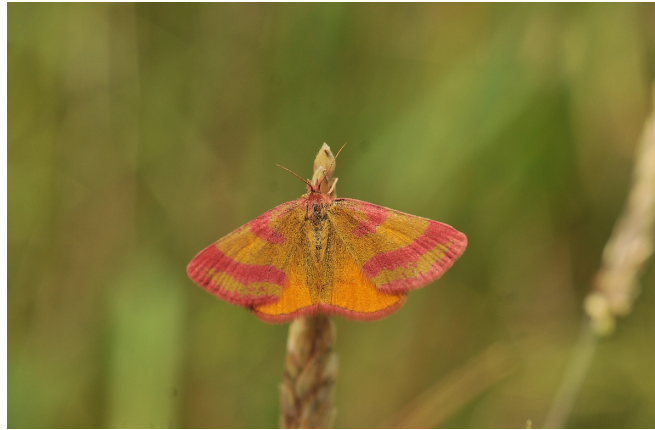
FIGURE 1 – test1

Nos résultats confirment la polyphylie du genre Polyommatus tel qu'actuellement circonscrit, en accord avec plusieurs études récentes. La subdivision en trois clades majeurs non-frères suggère que l'homogénéité morphologique externe masque une diversification ancienne, probablement antérieure au Pliocène. Cette situation n'est pas inédite chez les Lycaenidae où la convergence morphologique, particulièrement des structures alaires, a été documentée.